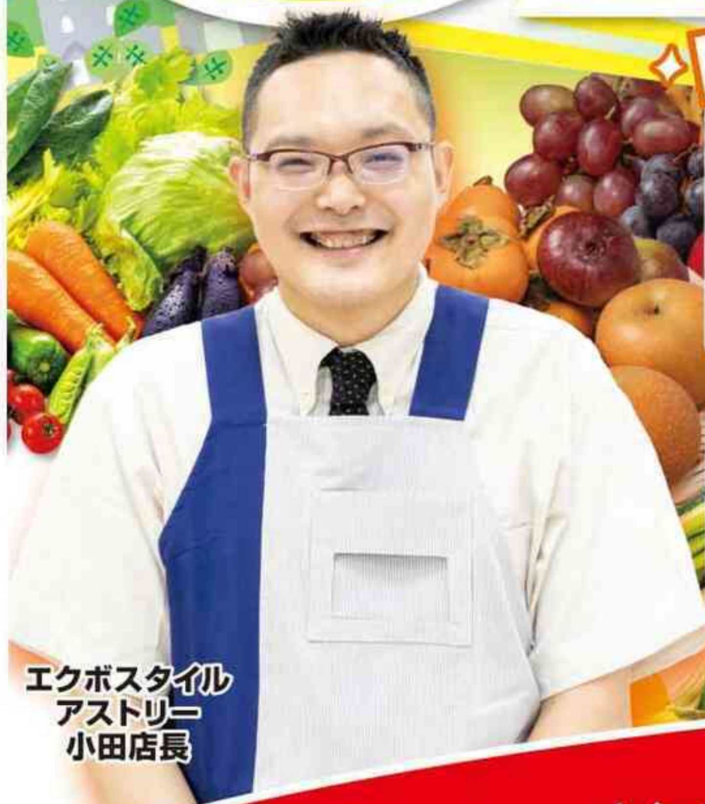
エクボスタイルアストリー 小田店員