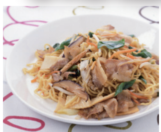
黒酢のさっぱり焼きそば