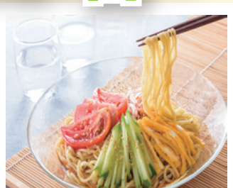
カンタン酢で冷やし中華